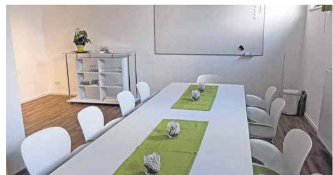
Für Seminare steht ein separater Raum zur Verfügung.